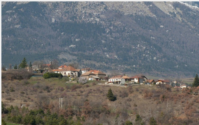
Jolie vue sur Céüse (CDRP05)