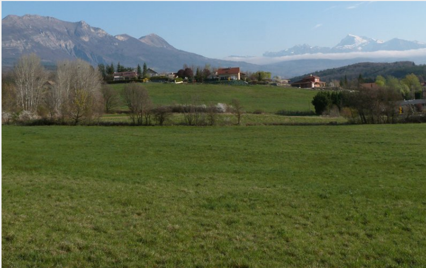
Quartier les Abadous (Gap) (CDRP05)