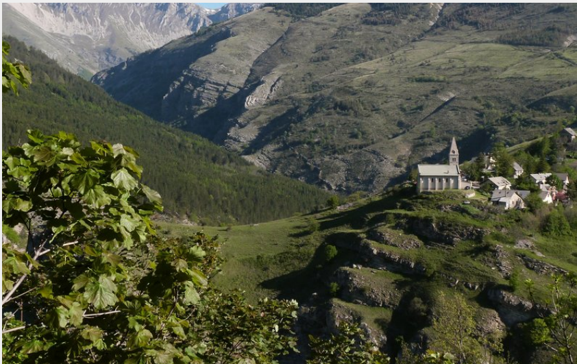
Village de Rabou (CDRP05)