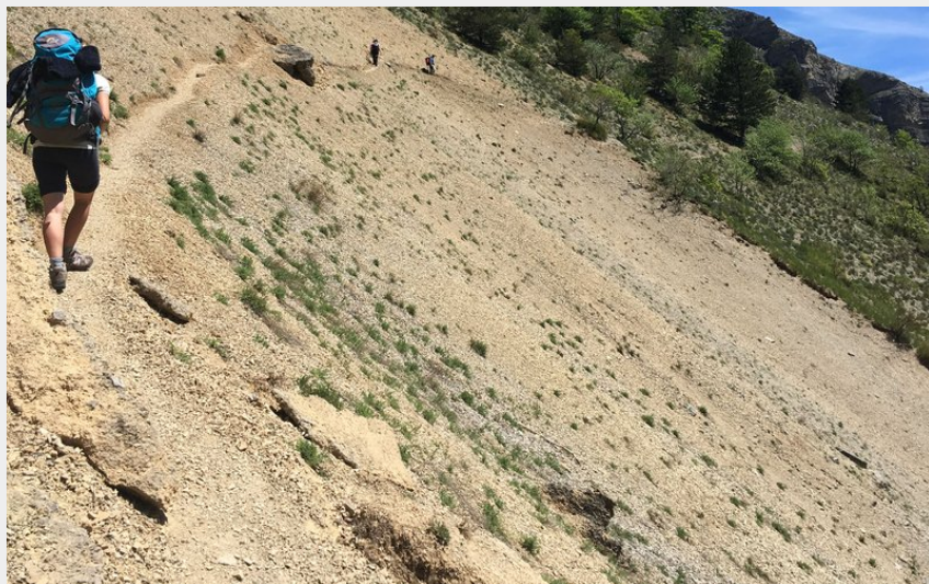
En direction de Rabou (CDRP05)