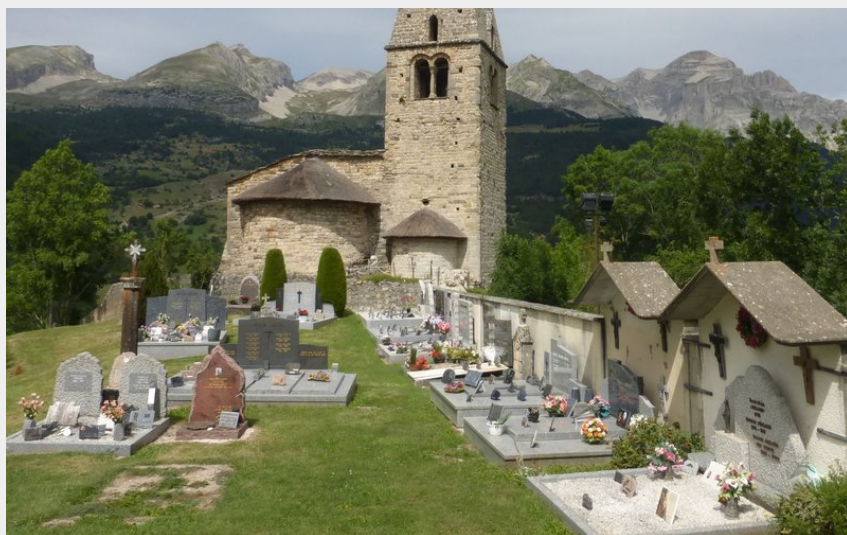
La Mère Eglise de St-Disdier, une des plus anciennes églises du département (CDRP05)