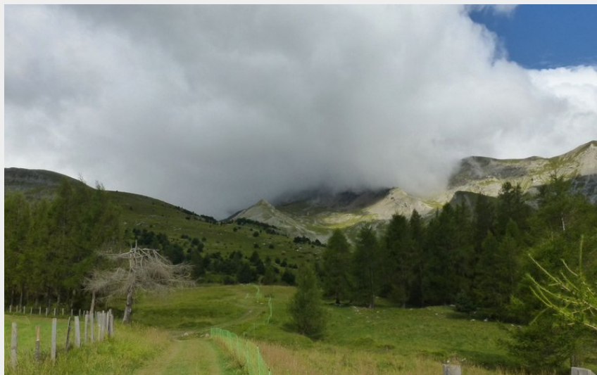
Au dessus du col de Festre (CDRP05)