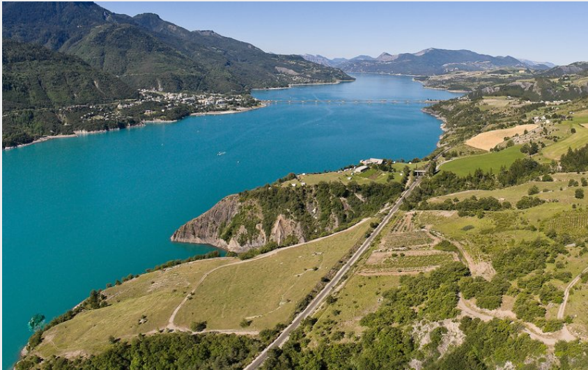
Lac de Serre-Ponçon