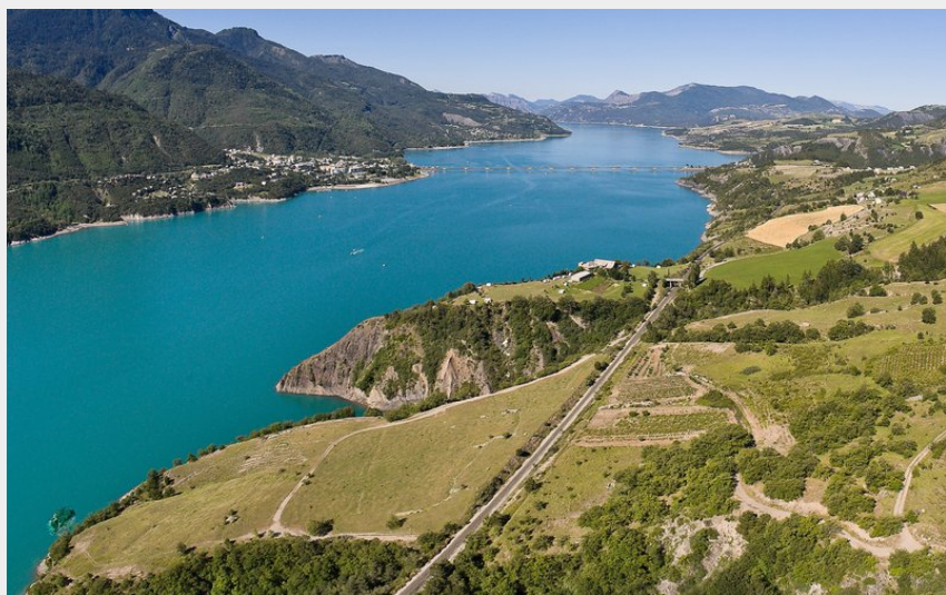
Lac de Serre-Ponçon