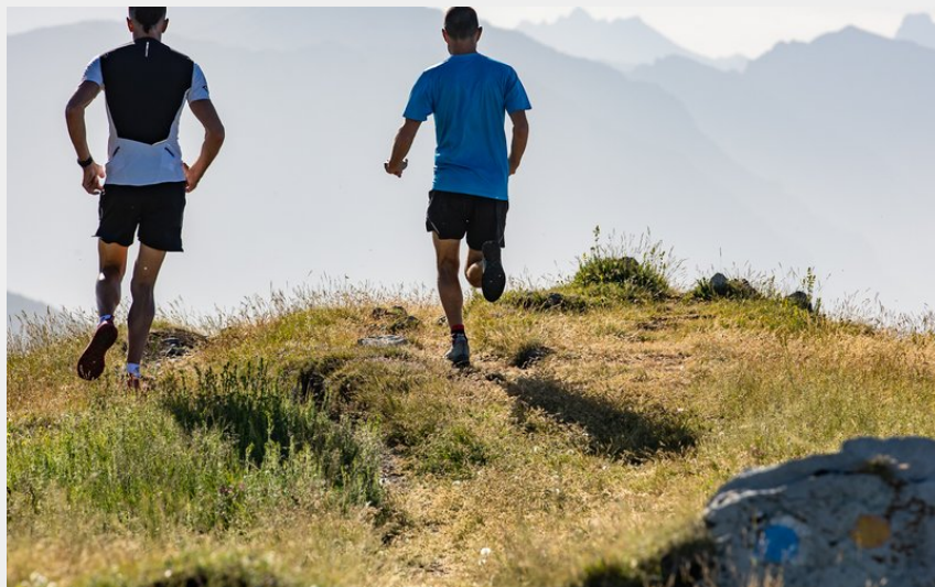
Trail Charges (Kina Photo)