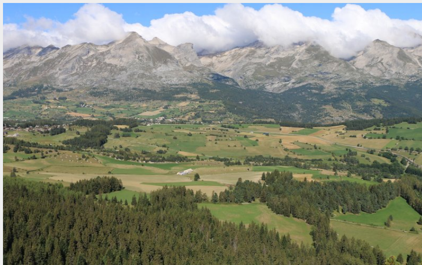
Le Dévoluy (Damien DESBENOIT)