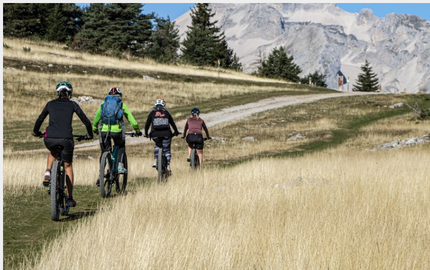
Sur la boucle des stations - en arrivant au collet du Tât