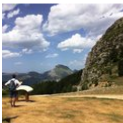
Table d'orientation et panorama (B)

Au collet du Tat, profitez d'une superbe vue sur Le Dévoluy