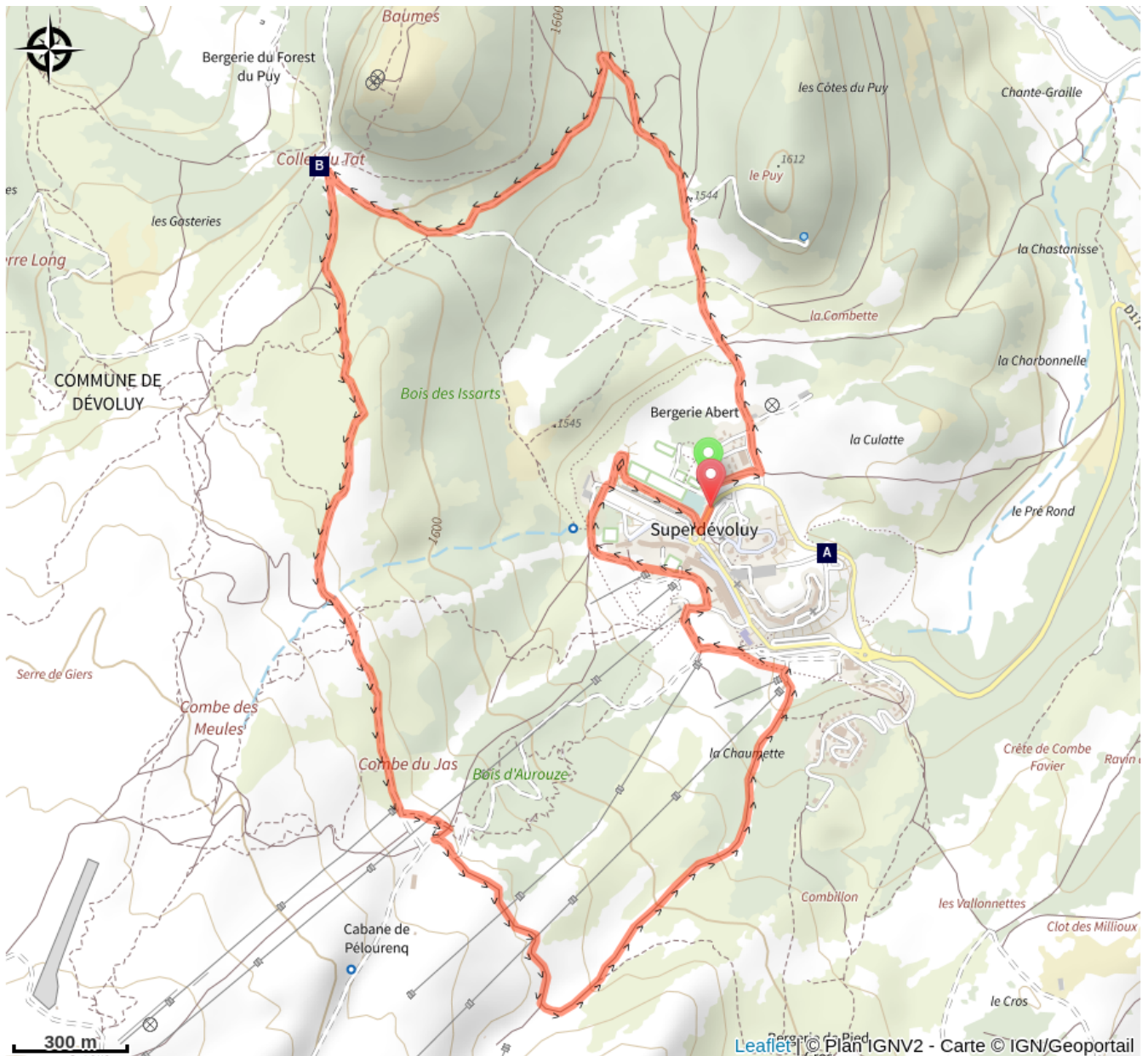
Domaine skiable SuperDévoluy (A)