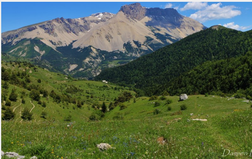
Paysage de l'Alpage de Boudelle (Damien DESBENOIT)