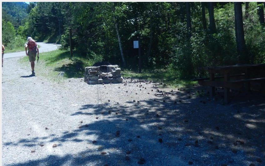
Aire de pique-nique (CDRP05)