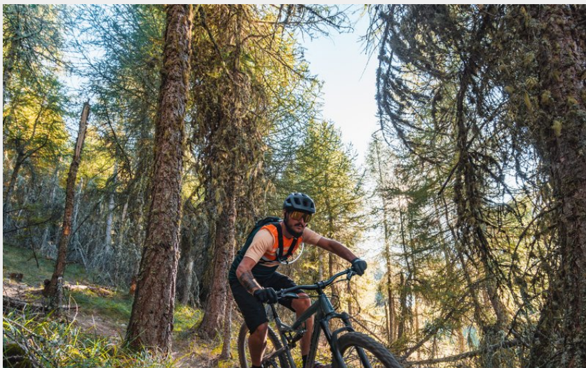
Beau single du Dévoluy en redescendant vers Superdévoluy