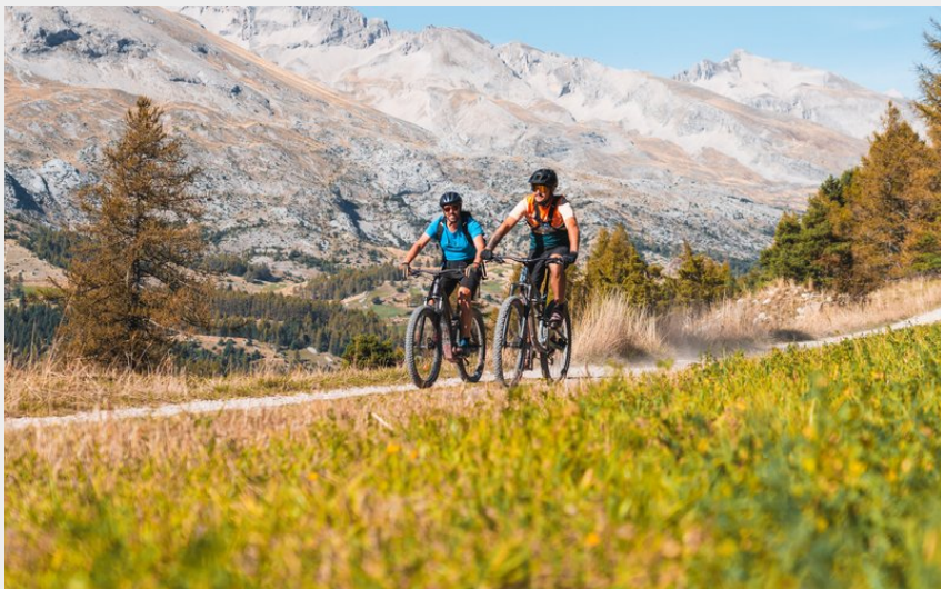
Sur la boucle des Mélèzes avec vue sur le Grand Ferrand