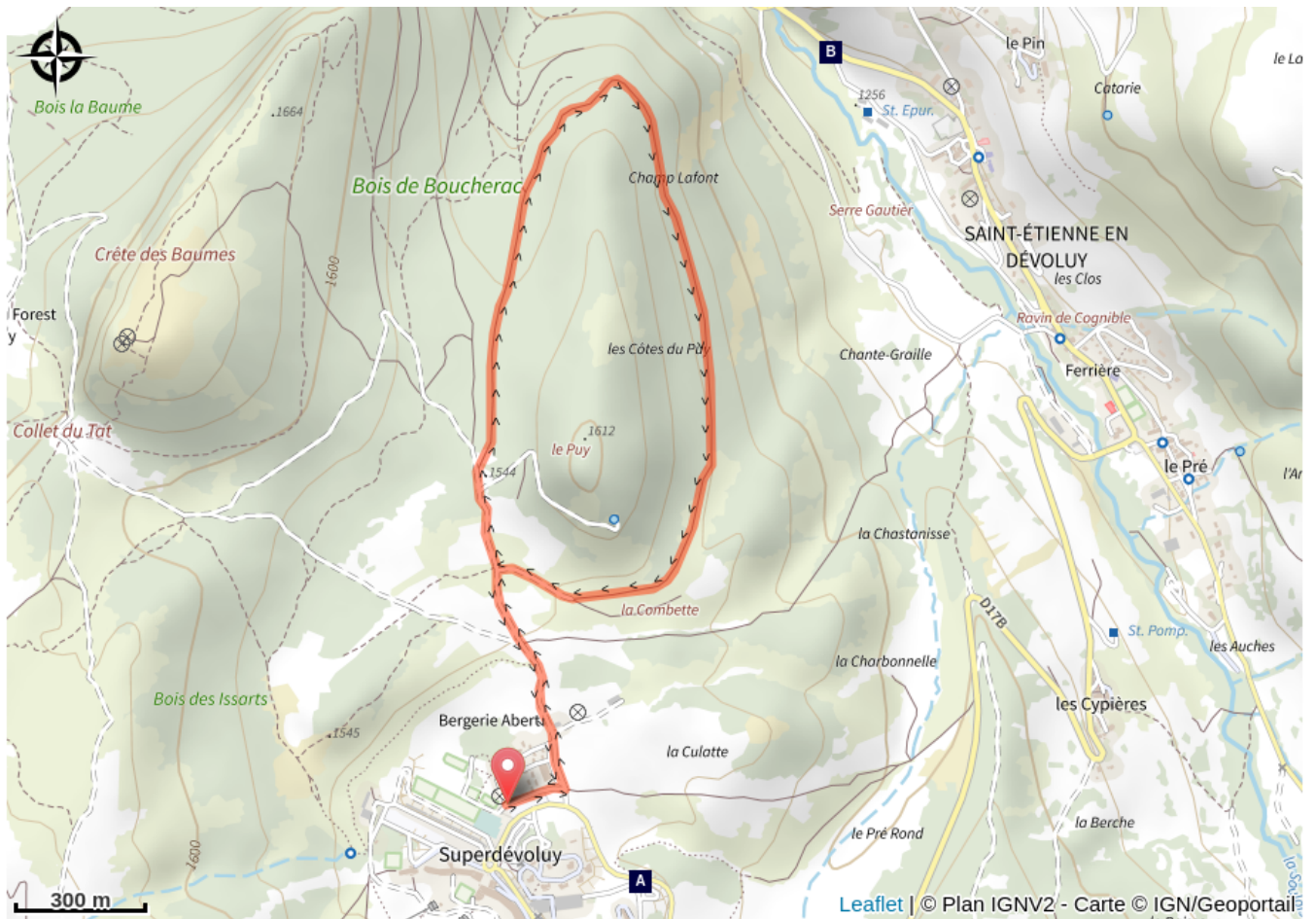
Domaine skiable SuperDévoluy (A)