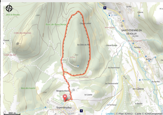
Au départ de SuperDévoluy en direction du Puy