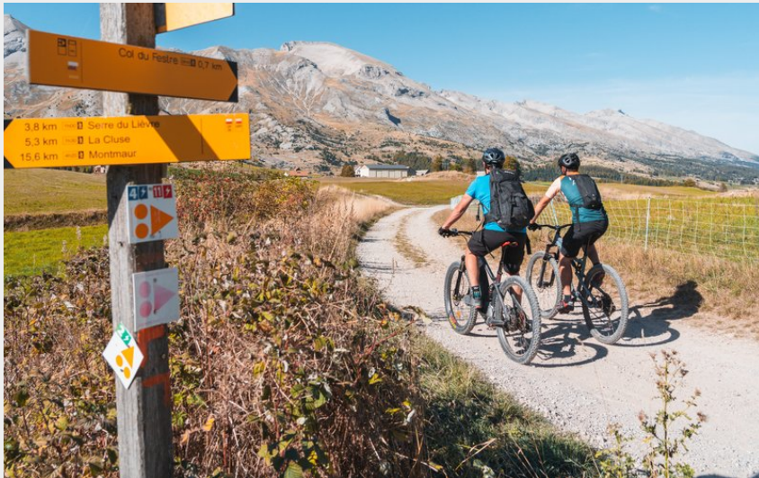
Vers le col du Festre