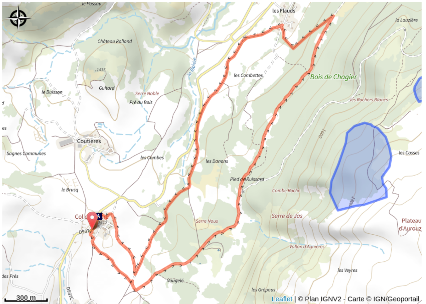
col du Festre (A)