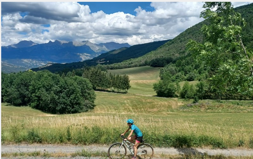
La Vallée de l'Avance (E. DANJOU)

CC Serre-Ponçon Val d'Avance - Valsерres