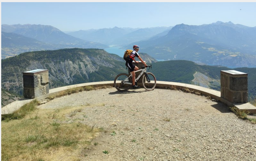
Le Lac depuis les sommet du Mont Colombis (E. DANJOU)