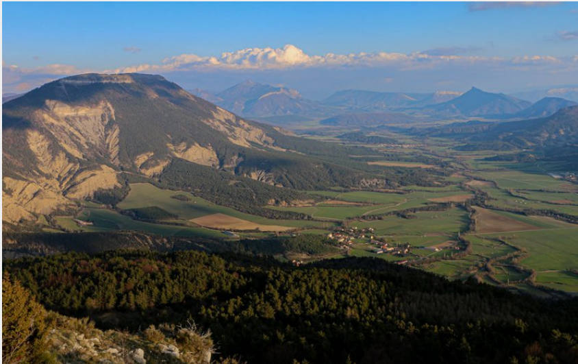
Lueurs du soir - val de Chauranne (Damien Desbenoit - CCBD)