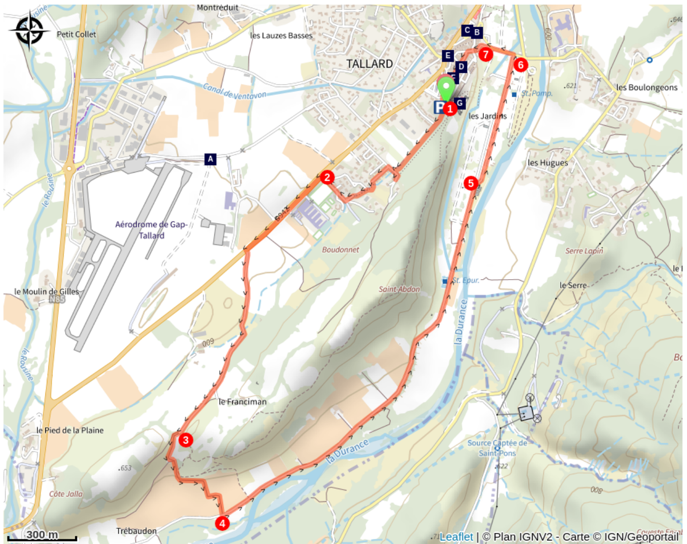
Table d'orientation (A) Fontaine (C) Ville de Tallard (E) Château de Tallard (G)

~~~~ Lavoir (B) ~~~~ Eglise Saint-Grégoire (D) ~~~~ Fontaine (F)