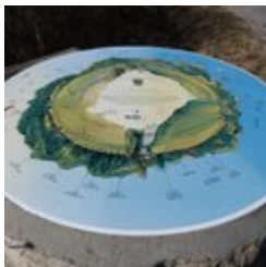
Table d'orientation (A)

Profitez de cette vue dégagée pour découvrir les montagnes alentours et voir les nombreux avions décoller depuis l'aérodrome.