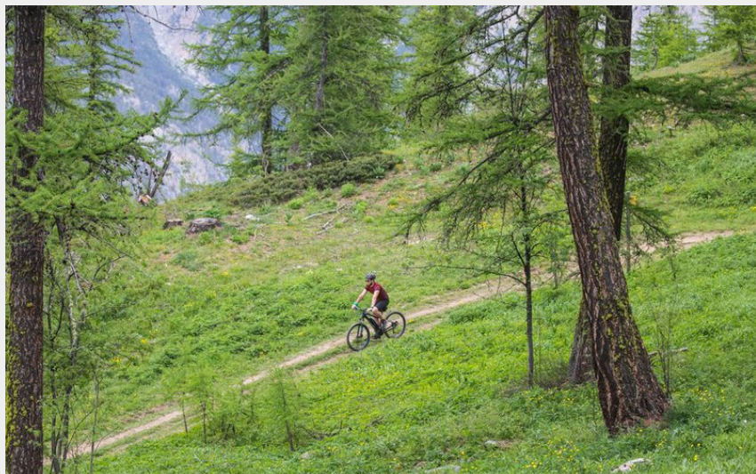
Grandes Têtes (Thibaut Blais)

CC du Pays des Ecrins - Puy-Saint-Vincent