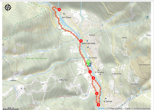
(Rogier Van Rijn)