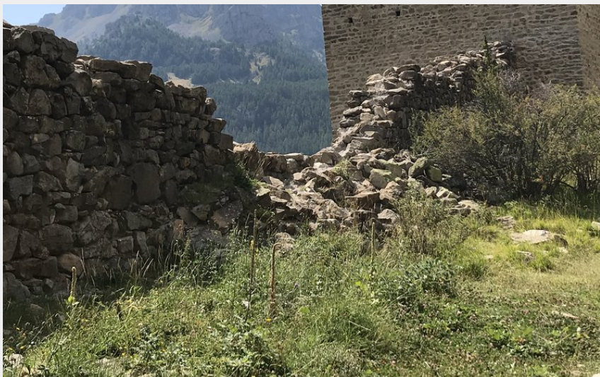
Fort de Réallon avec les Aiguilles de Chabrières (CDTE Hautes-Alpes)