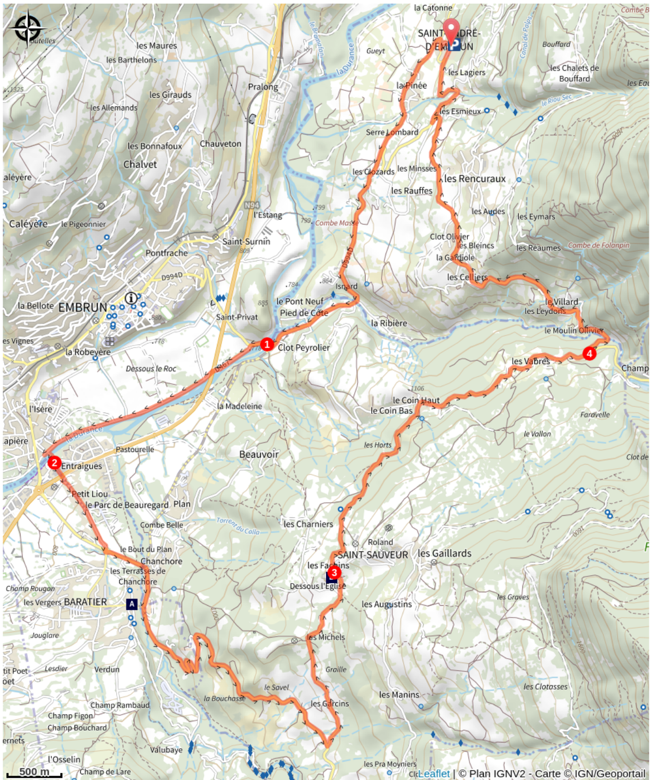
Village de Baratier (A)