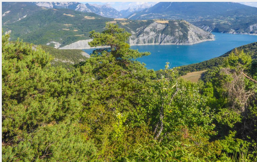
Vue sur le lac (Thibault CHABERT)