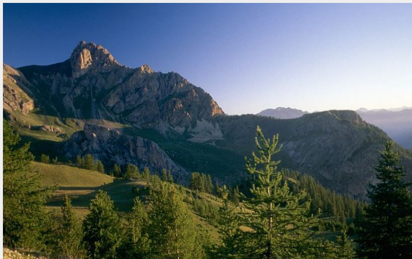
La tête de Gaulent vue depuis les abords de la crête de la Selle (Claude Dautrey - Parc national des Écrins)