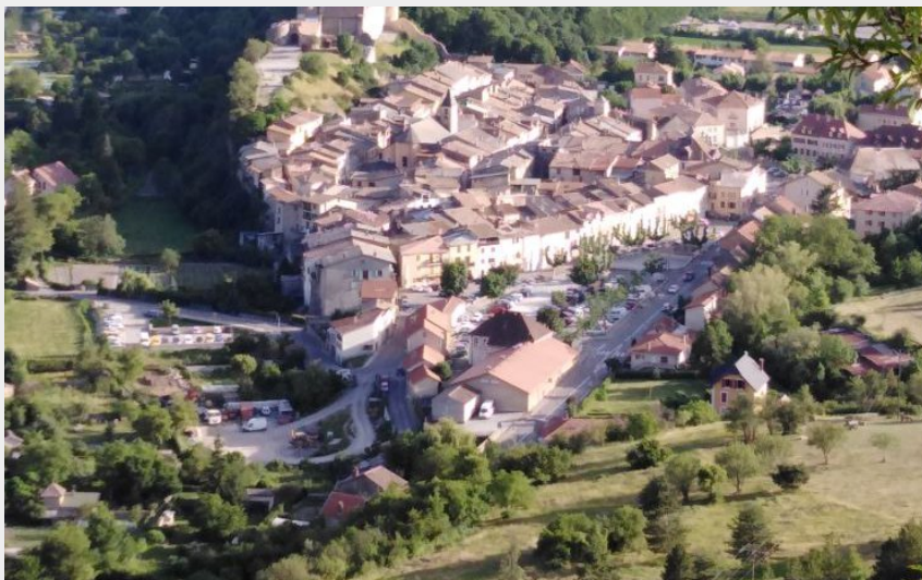
Colline Saint-Abdon (Véronique Roubeau)