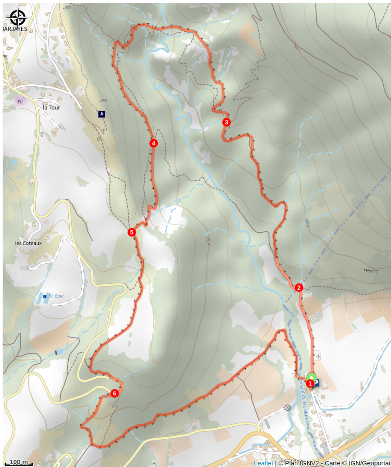
Table d'orientation de Jarjays (A)