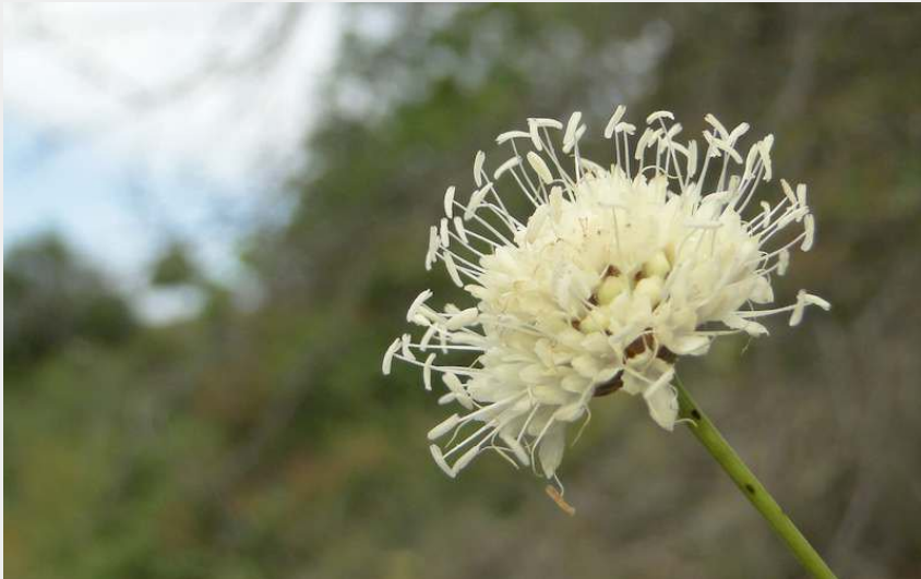
Céphalaire à fleurs blanches (Benjamin Ferlay)