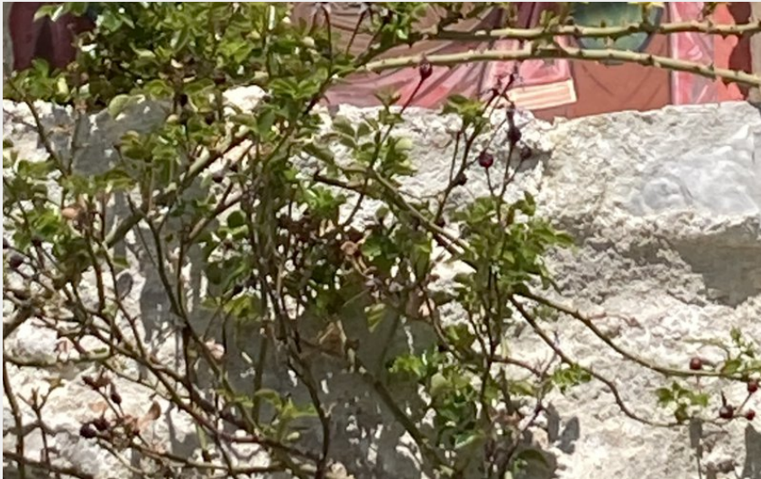
(Marie Batault - CDRP)