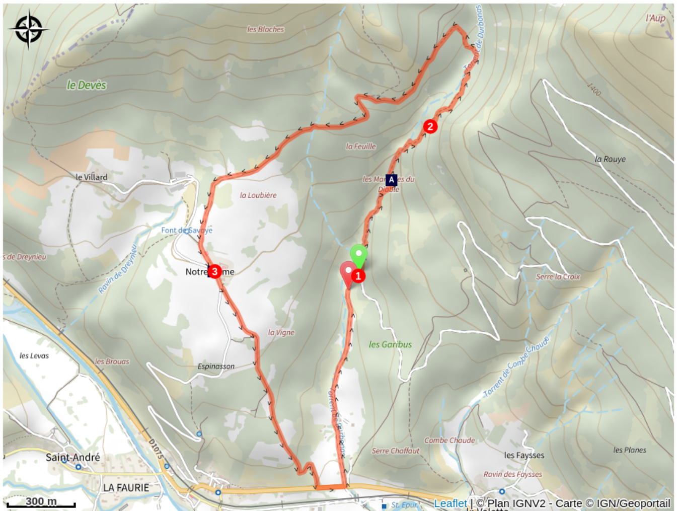
Les marmites du Diable (A)