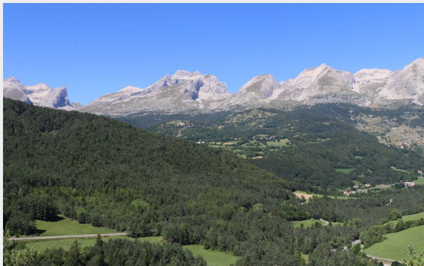
Le Fai (Damien Desbenoit - CCBD)