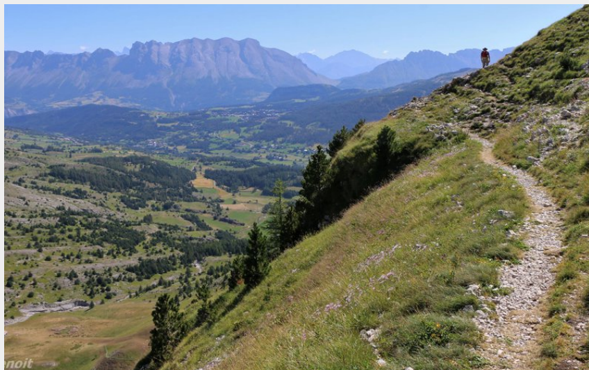
Col des Aiguilles (Damien Desbenoit - CCBD)