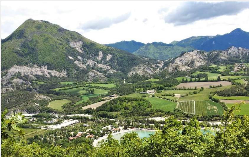
Le plan d'eau et le val d'Oze vus de l'Eygau