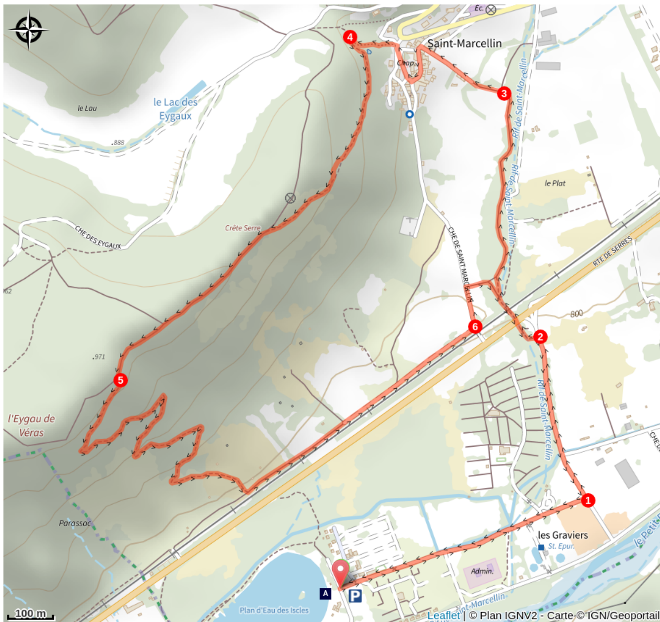
Plan d'eau des Iscles (A)