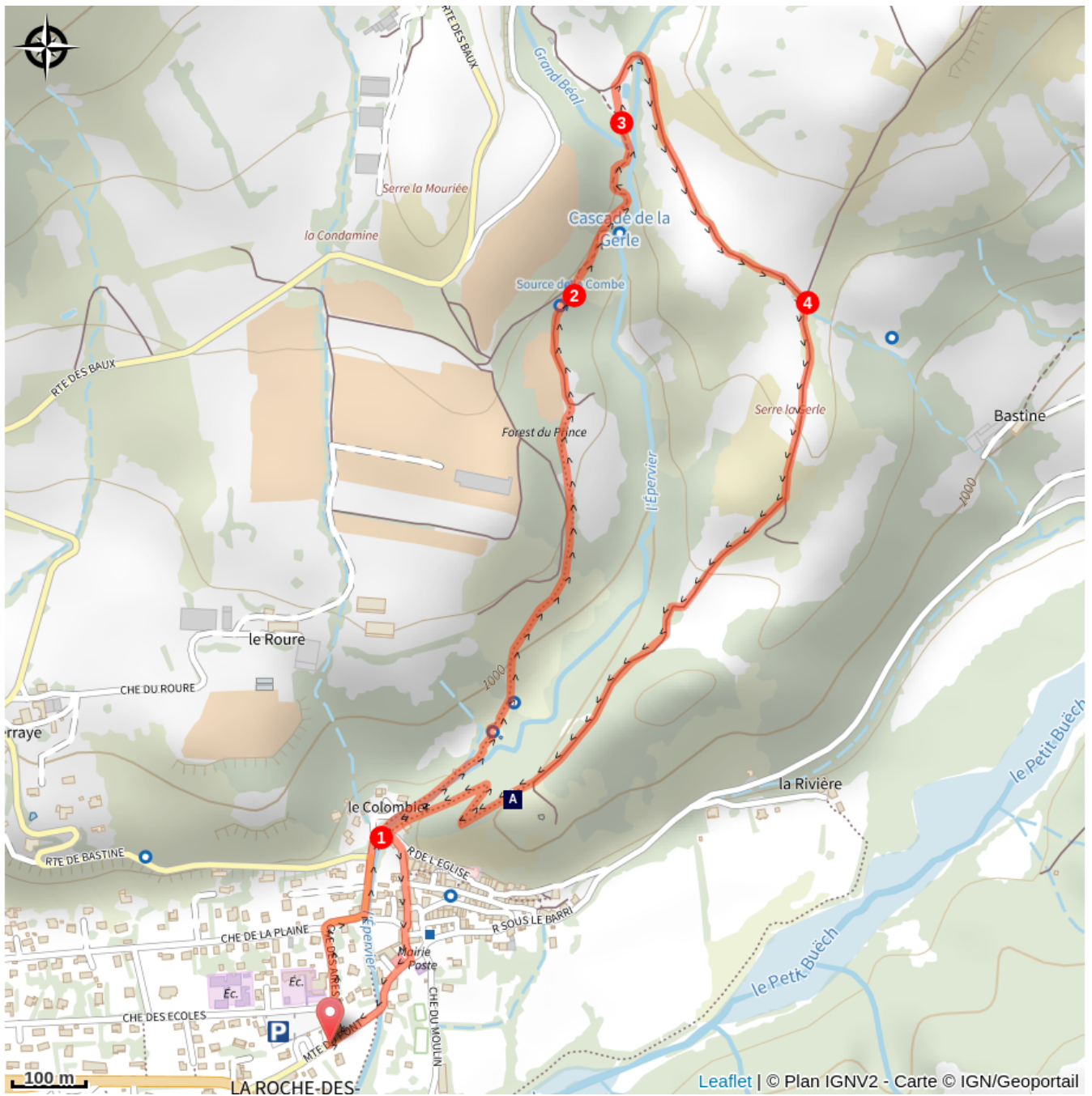
Château de la Roche des Arnauds (A)