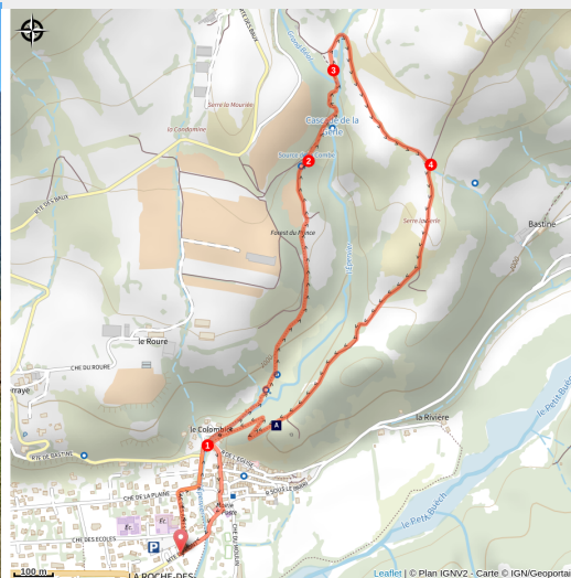
Serre la Gerle (Damien Desbenoit - CCBD)