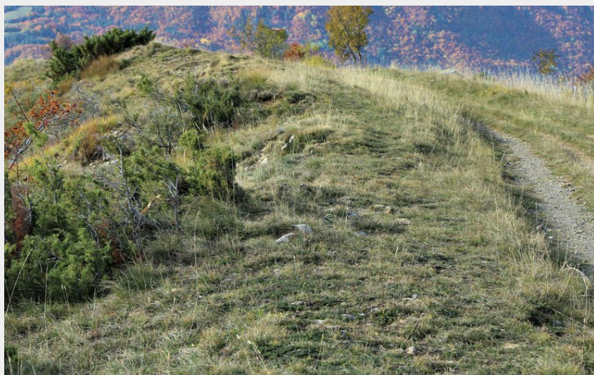
Serre la Gerle (Damien Desbenoit - CCBD)