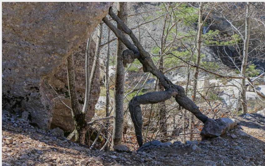
Land art (Damien Desbenoit - CCBD)