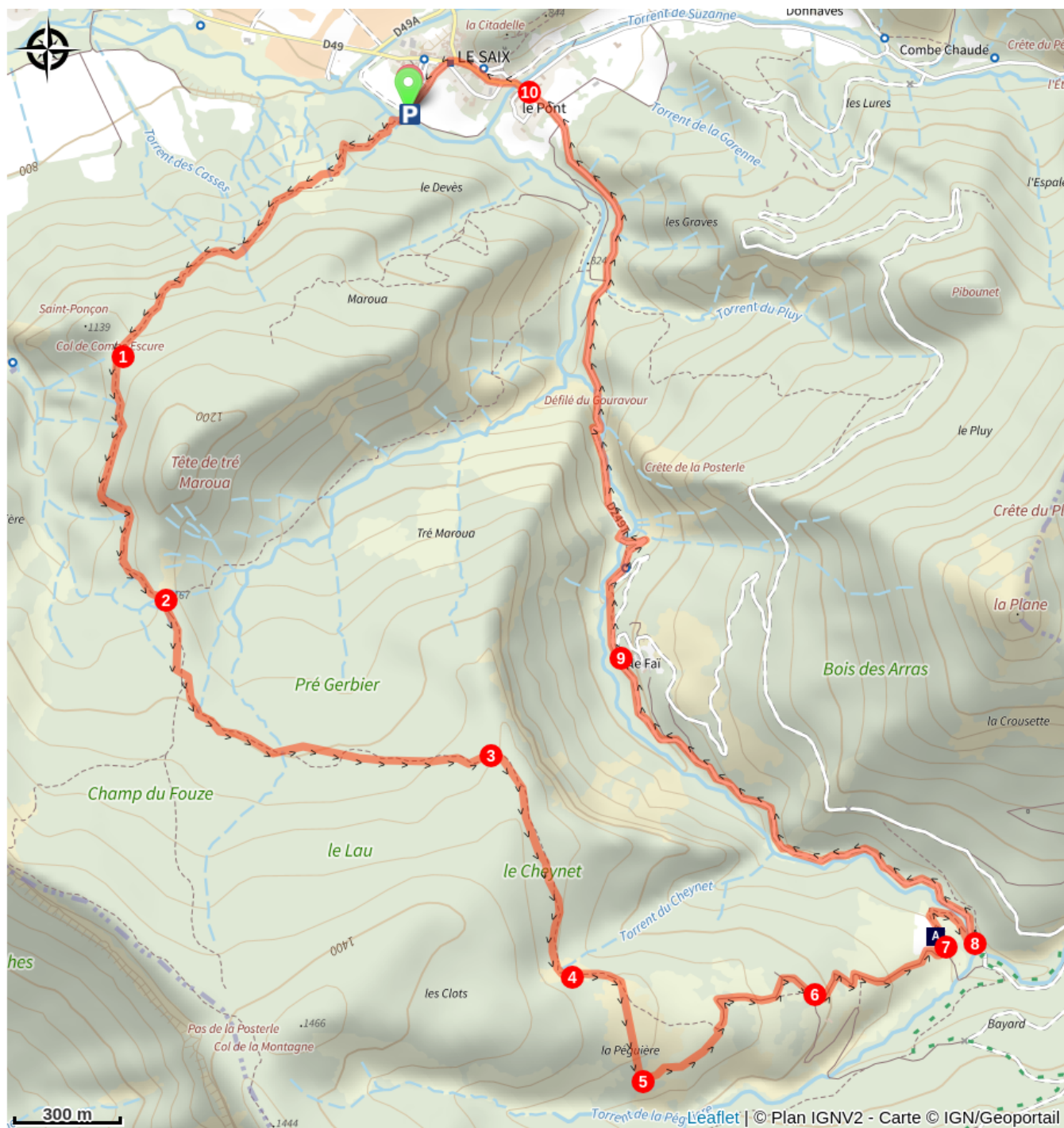
Vestige de l'Abbaye de Clausonne (A)