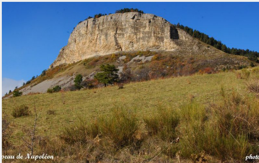
Le chapeau de Napoléon (Michel Poissonnier)