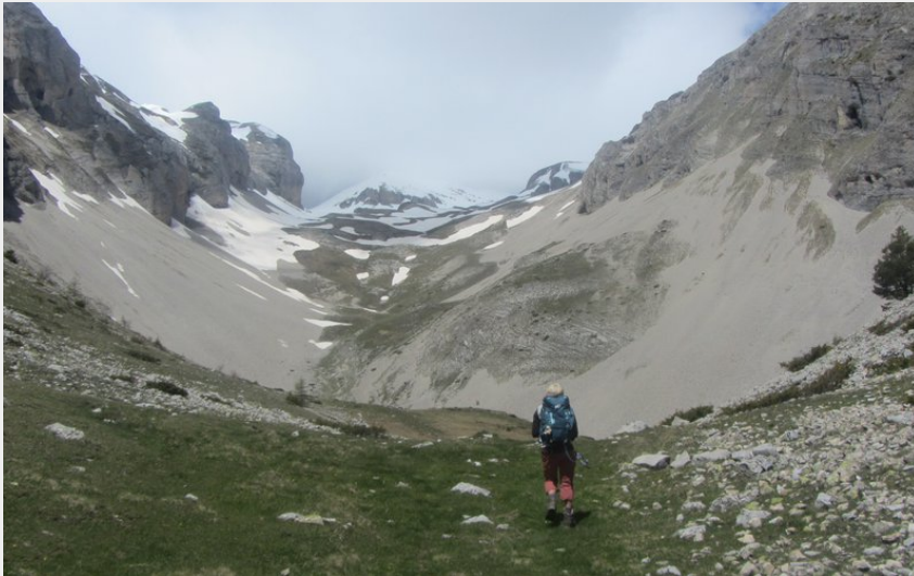
Au cœur du Dévoluy (C. Chevrette - CDRP)