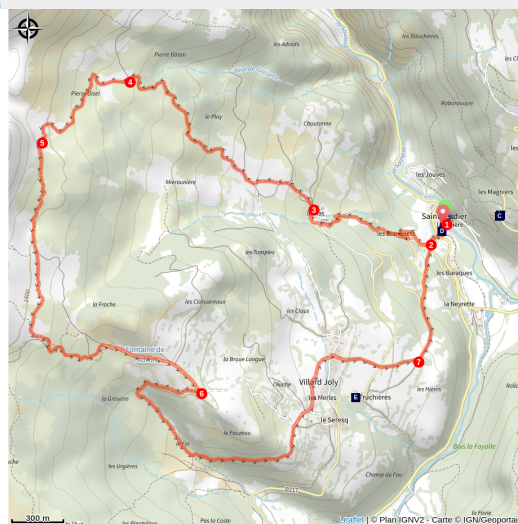
Au loin, les contreforts Est du massif

Une randonnée variée en balcon entre forêts, prairies et lapiaz pour découvrir l'ensemble du synclinal du Dévoluy !