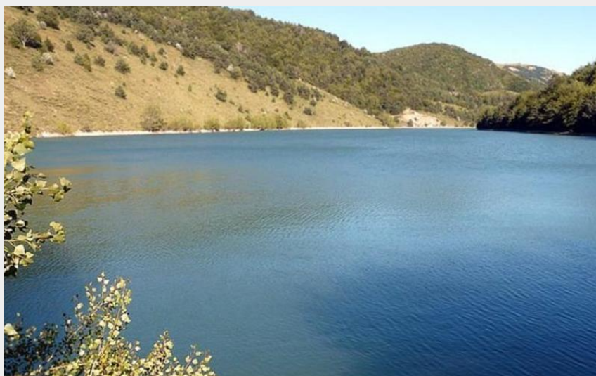
Lac de Peyssier (CCBD)