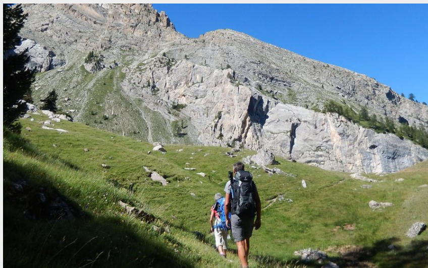
Aux abords de la Crête de la Mourière (CDRP05)