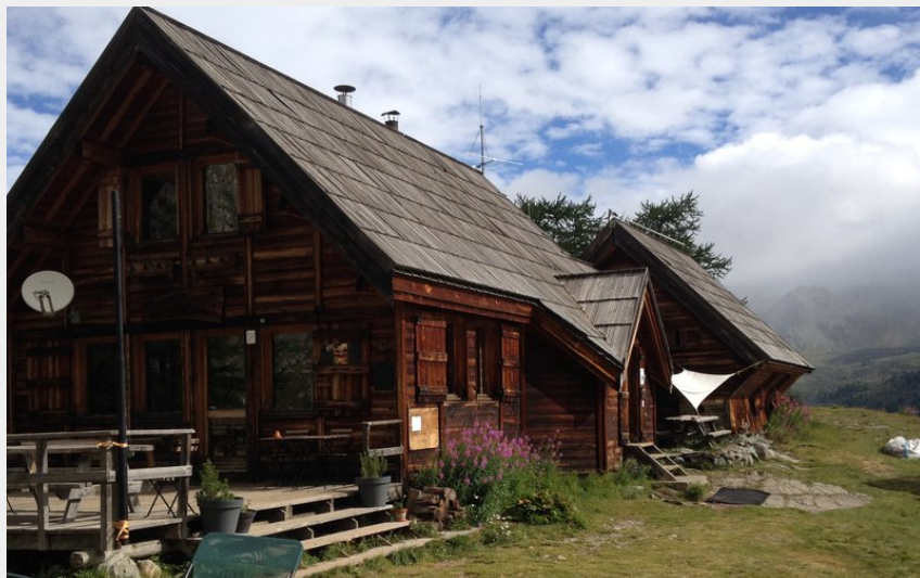
Refuge du Chardonnet (CDRP05)