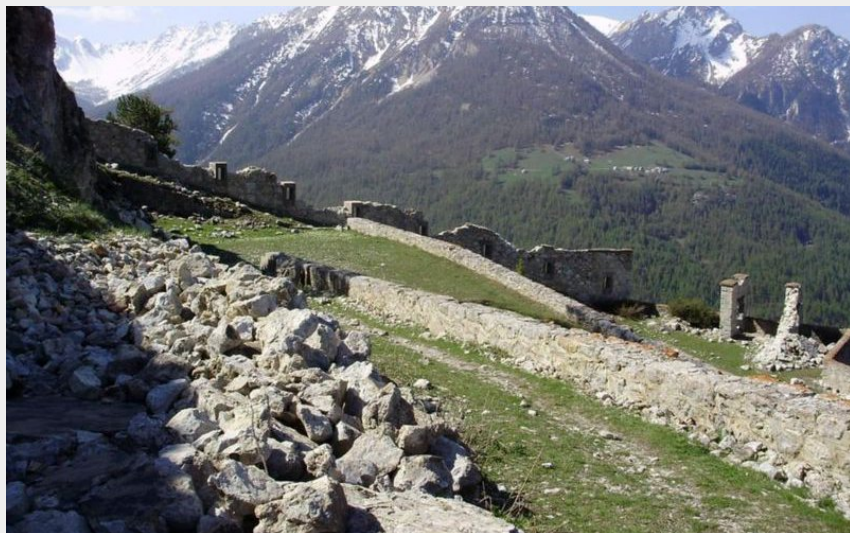
Fort de la Croix de Bretagne (CDRP05)