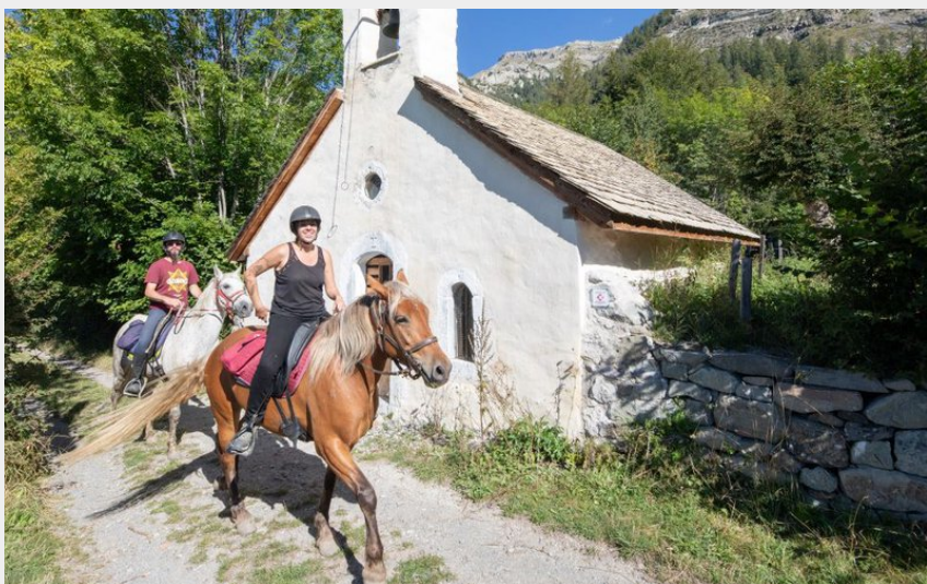
Chapelle des Roranches (Parc national Ecrins - Thibaut Blais)

Aire d'Adhésion du Parc National des Écrins - Saint-Léger-les-Mélèzes