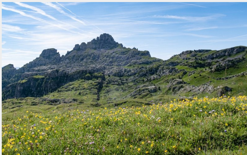
Les Aiguilles de Chabrières et l'Oucane