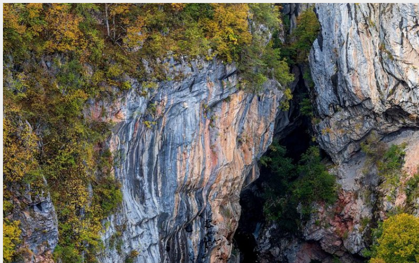
Gouffre de Gourfouran à l'automne (Parc national des Écrins - Thierry Maillet)