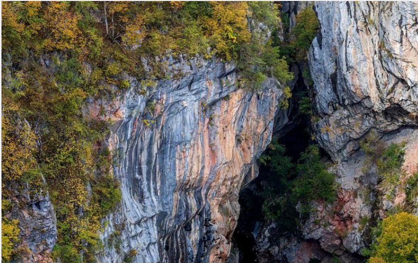
Gouffre de Gourfouran à l'automne (Parc national des Écrins - Thierry Maillet)