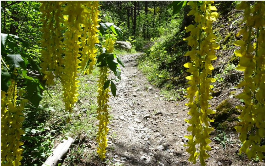
Le sentier du Cloutas