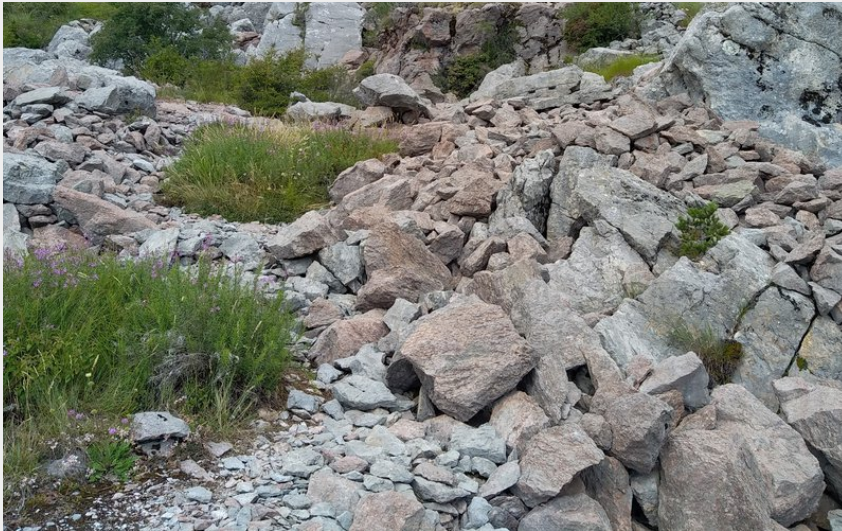
Carrière de Salados (Etienne Charles)