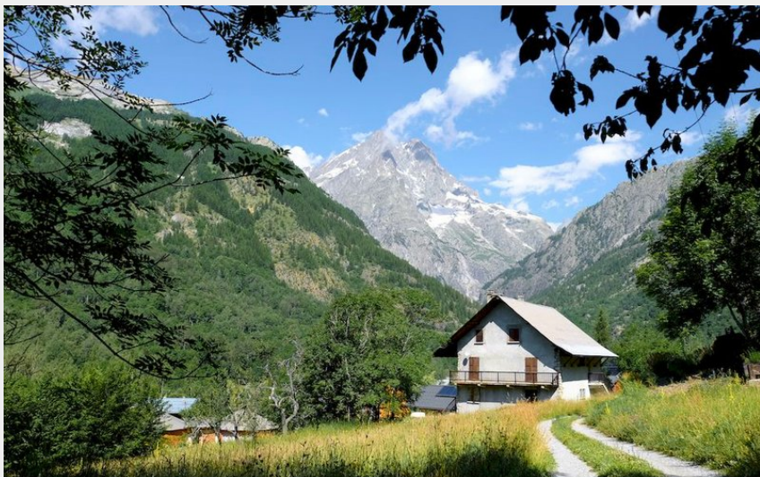
Vallée de la Vallouise et Mont Pelvoux (Pays des Écrins - Pierre Nossereau)