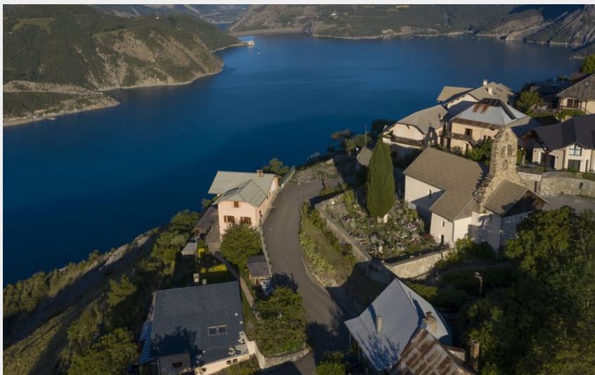
Village du Sauze-du-Lac (Le Naturographe)