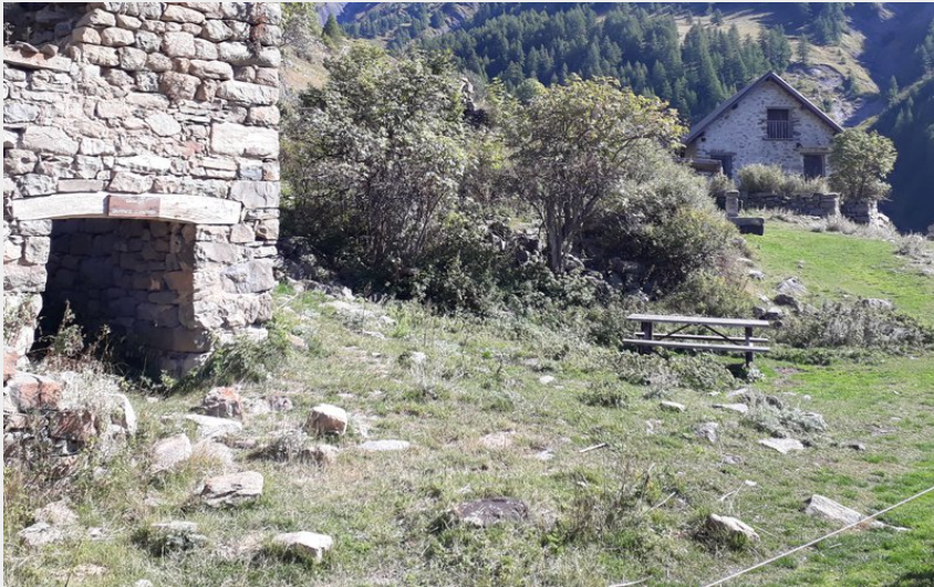
Méollion (J.F. Arnaud - CDRP)