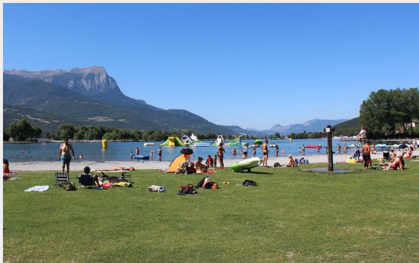
Plage du Plan d'eau